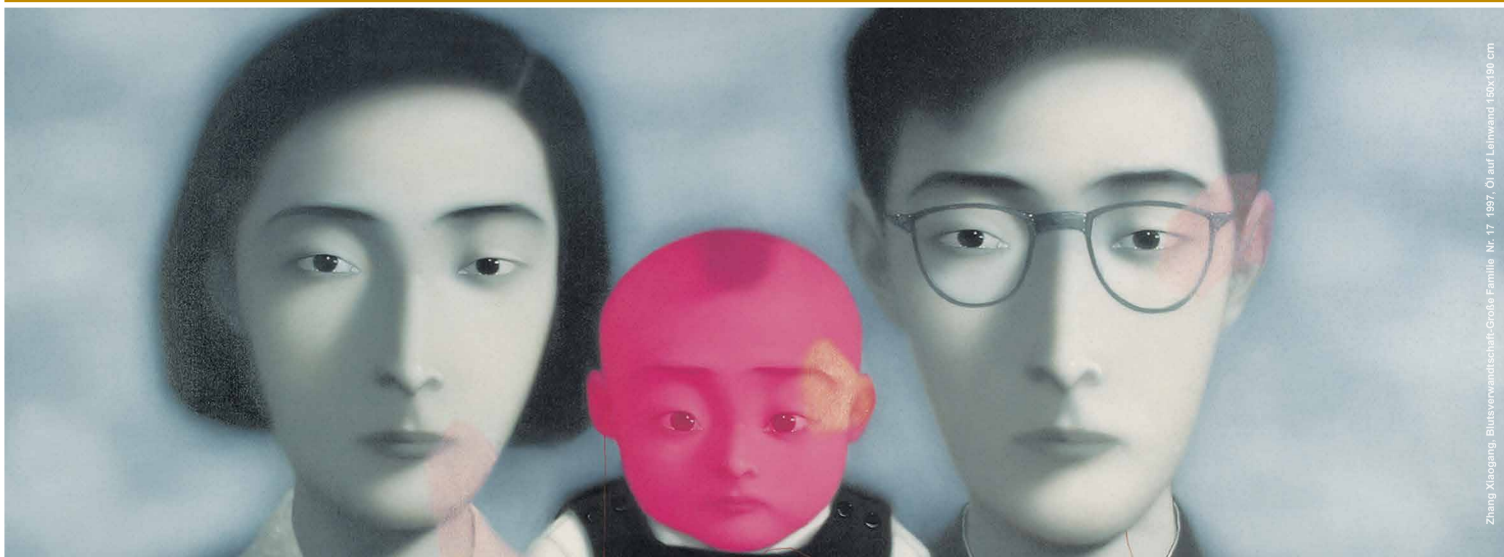
Zhang Xiaogang, Blutsverwandtschaft-Große Familie Nr. 17 1997, Öl auf Leinwand 150x190 cm

28.10. Workshop, jeweils 9-17 Uhr, Orangerie, Institut für Kunstgeschichte, Mediathek Westliches Kunstsystem und chinesische zeitgenössische Kunst 1980-2015